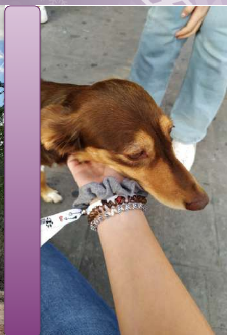
26 y 27 de octubre de 2019